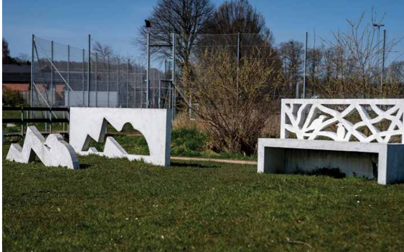
Finn Have, billedkunstner (1952): Fuglebænken m.m., 2016.