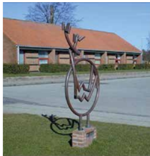
Det har desværre ikke været muligt at få et større billede, da skulpturen pt. er under reparation.