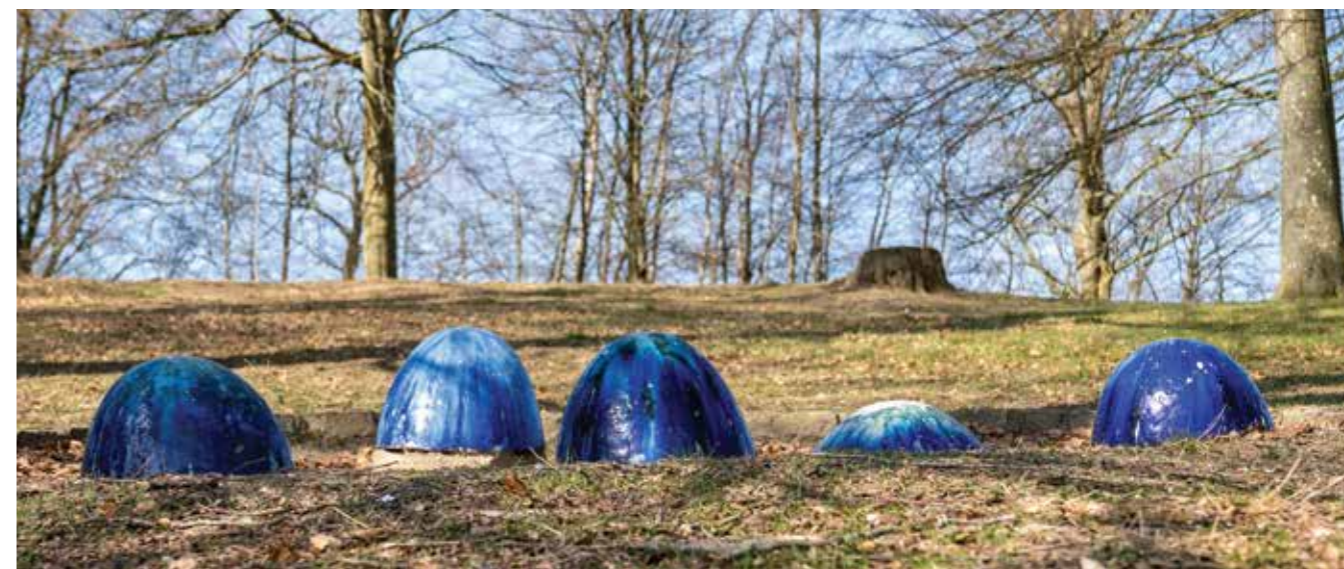
VED RESTAURANT SKOVBAKKEN