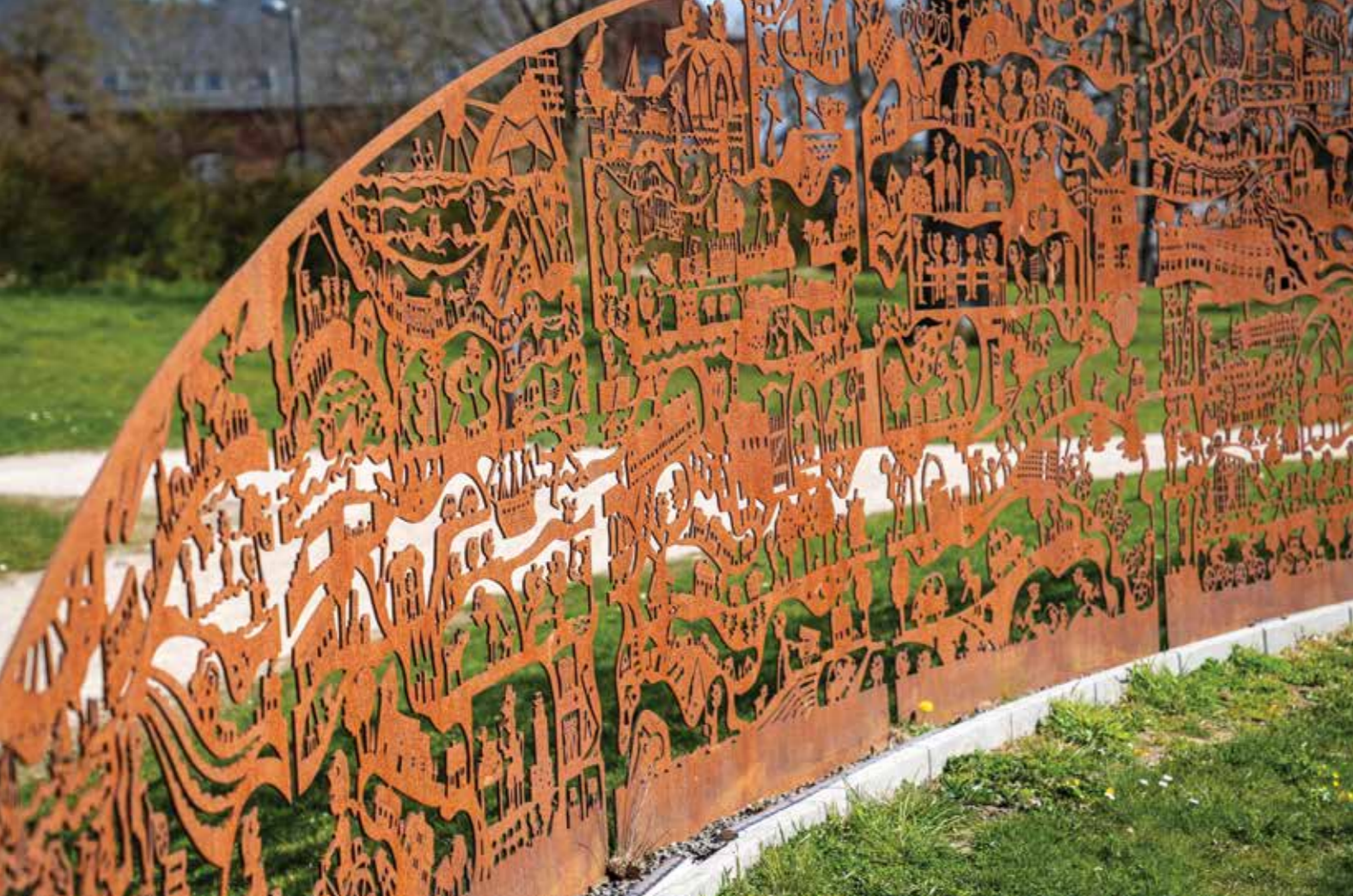
VITAPARK, VITAVEJ /RANDLEVVEJ